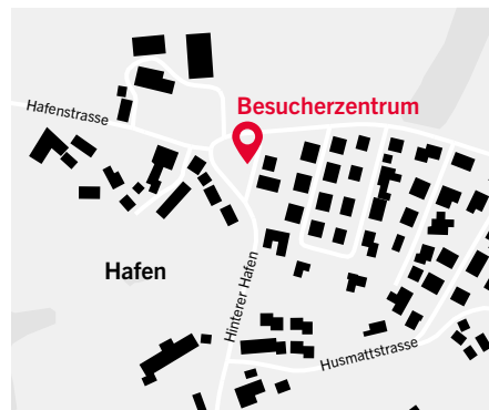
↑ Standort des geplanten Besucherzentrums im «Spitz»

Swissgrid verlegt am Gäbihübel erstmals ein Höchstspannungskabel einer 380-kV-Leitung unter die Erde. Sie will das Projekt nutzen, um mit der Öffentlichkeit die Chancen und Herausforderungen einer Erdverkabelung zu diskutieren. Zu diesem Zweck plant Swissgrid voraussichtlich ab Mai 2019 im Gebiet «Spitz» in Hafen ein temporäres Besucherzentrum. Das entsprechende Bewilligungsverfahren läuft. Im Rahmen der Eröffnung plant Swissgrid, die Bevölkerung der umliegenden Gemeinden zu einem Tag der offenen Tür einzuladen.