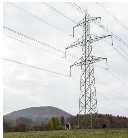
↑ Solche Freileitungsmasten werden in unterschiedlichen Grössen nördlich und südlich des Gäbihübels errichtet.