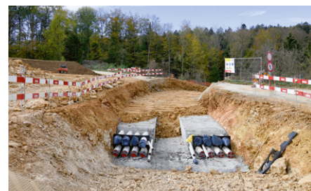
Teilweise wieder aufgefüllter Kabelgraben mit den beiden Kabelrohrblöcken. Zu sehen sind die Kabelschutzrohre, in welche später die Stromkabel eingezogen werden.