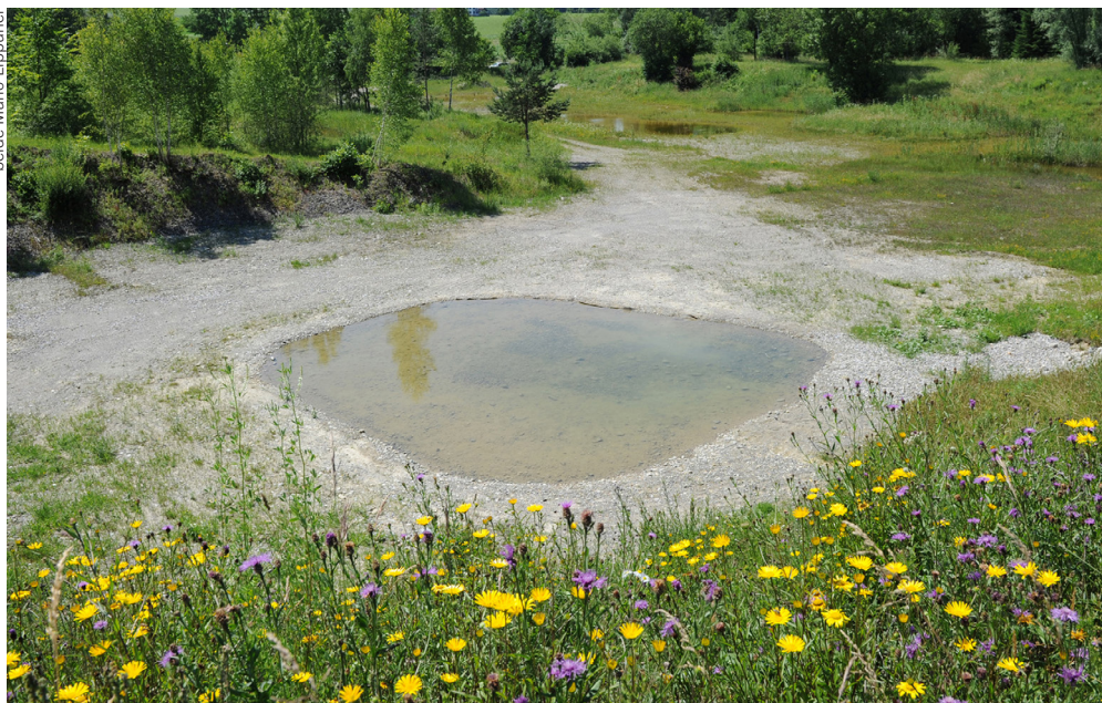
In dieser ehemaligen Kiesgrube bei Rickenbach ZH liess sich die Gelbbauchunke erfolgreich fördern, indem die vielfältigen Lebensraumsprüche konsequent berücksichtigt wurden. Ähnliche Massnahmen sollen in den nächsten Jahren der Gelbbauchunke im Kanton Graubünden zugute kommen.

Hochwasser oder bei saisonal ansteigendem Grundwasserspiegel entstehen. Unter Freilandbedingungen können Gelbbauchunken, die bis zu 15 Jahre alt werden, die Reproduktion bei ungünstigen Bedingungen über Jahre aussetzen.