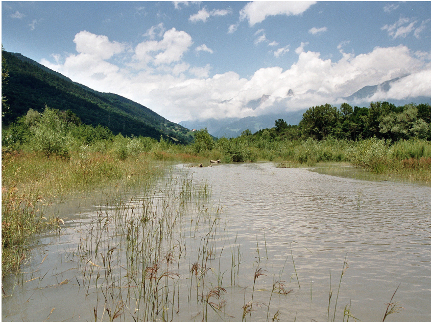
In der ursprünglichen Flussaue des Rheintals war die Gelbbauchunke vor der Korrektur im 19. und frühen 20. Jahrhundert häufig anzutreffen. Stellenweise, wie hier bei Untervaz, konnte sich die Gelbbauchunke in kleinen Relikten der ursprünglichen Aue halten.

sprachen. Die Lebensräume in den Kolmatierungsanlagen und Kiesabauflächen verschwanden jedoch ab den 1950er-Jahren grösstenteils wieder. Alles in allem gingen sämtliche